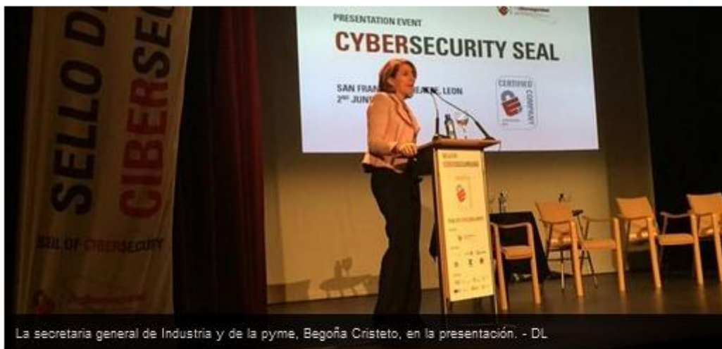
La secretaria general de Industria y de la pyme, Begoña Cristeto, en la presentación. - DL